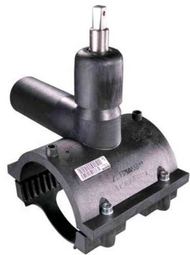
1 Вентиль для врезки под давлением (крановая седелка) Frialen, тип DAV

Изделие типа DAV – это элемент узла распределительного газопровода, монтируемый посредством электросварного седла с последующей врезкой под давлением. Вентиль позволяет сформировать отвод от распределительного газопровода с выходом на газопровод-ввод, при этом имеет встроенный механизм перекрытия потока среды в направлении газопровода-ввода с возможностью многократного отключения потребителя. По информации, предоставленной производителем FRIATEC AG, по состоянию на начало 2014 года в мире эксплуатируется свыше 1 млн изделий, из которых более 50% применя-